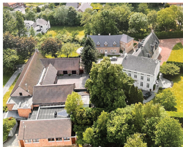
La Franche Comté