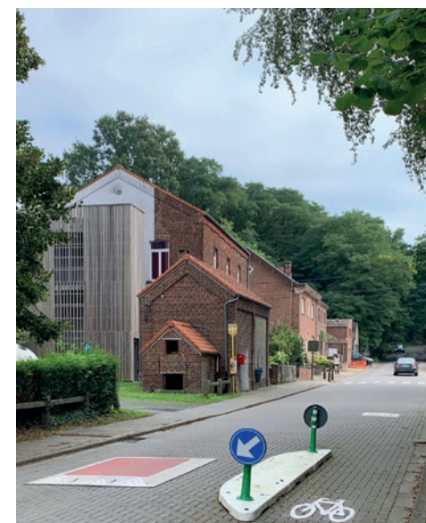
Sécurité Routière dans le centre de Nodebais