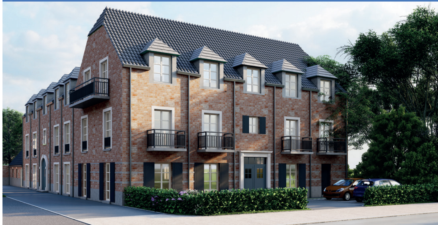
Résidence Seniors à Hamme-Mille