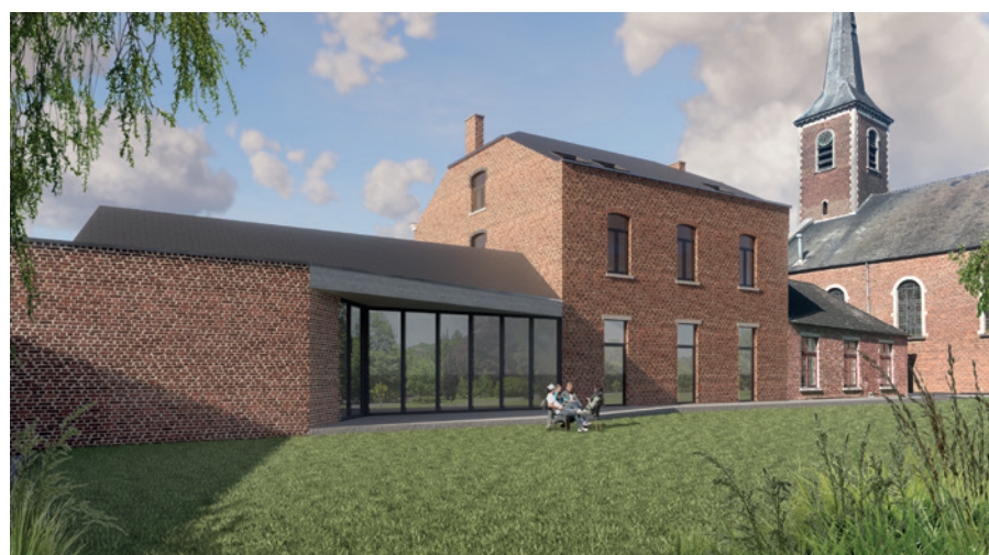
Nouveaux logements intergénérationnels et salle polyvalente à la cure à La Bruyère