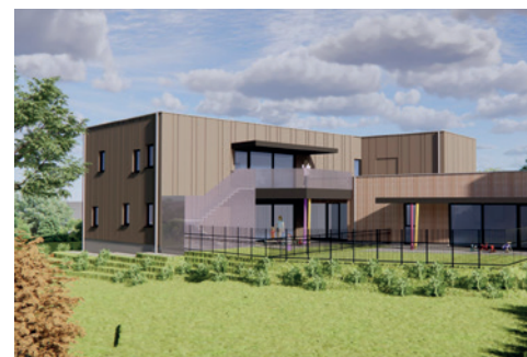
La nouvelle crèche 42 places à Hamme-Mille