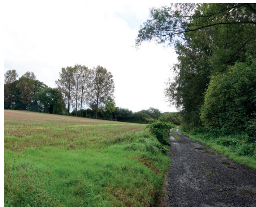
Future station d'épuration de L'Ecluse